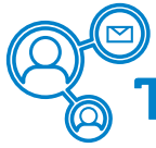
Tabla de servicios por tipología de clientes